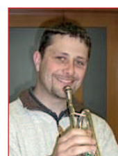
Helmut Rumpf Blechblasinstrumente